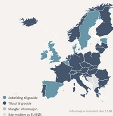
Figur 1: Tilbud om vaksine til gravide i EU/EØS oppdatert 12.august 2021

Land i Europa som tilbyr vaksinasjon til alle gravide mot covid-19 dersom den enkelte selv ønsker det. Dette gjelder også USA og Israel av land utenfor Europa. Enkelte land tilbyr foreløpig ikke en generell vaksinasjon til alle gravide, men anbefaler at man tar en individuell risiko-nytte vurdering med lege før evt. vaksinasjon.