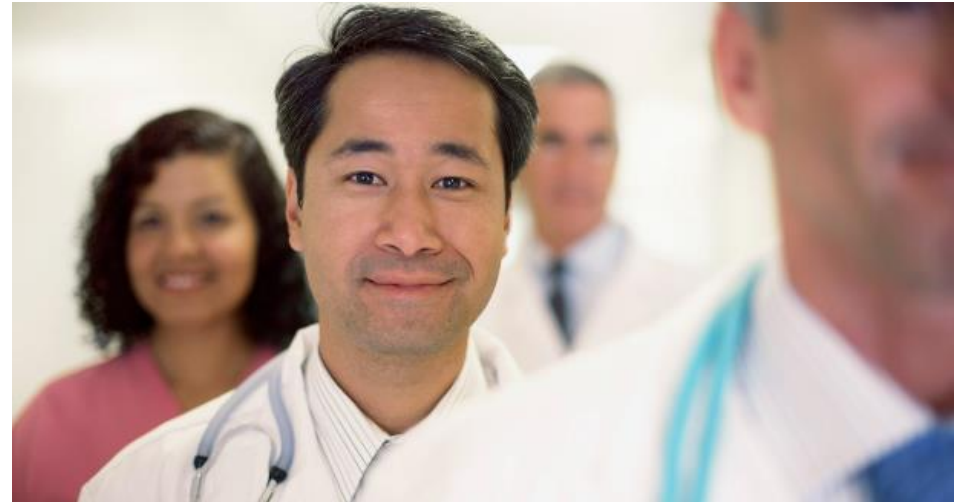
Avtalespesialister - Helsenorge